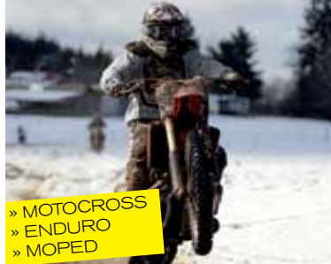
» MOTOCROSS » ENDURO » MOPED