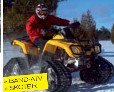
» BAND-ATV » SKOTER