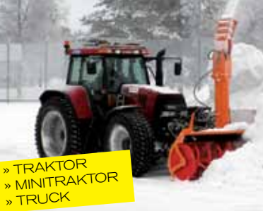
» TRAKTOR » MINITRAKTOR » TRUCK