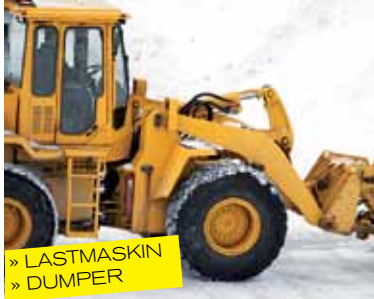
» LASTMASKIN » DUMPER