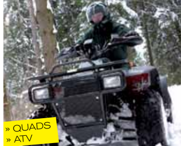
» QUADS » ATV